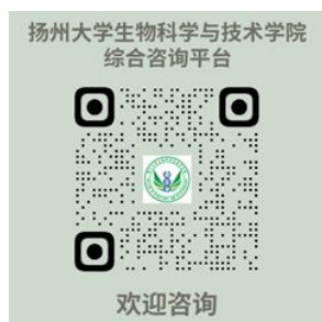
综合咨询平台（QQ 或微信扫码）